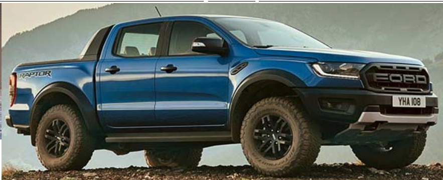
Slika levo zgoraj: Stilska Raptor polepitev Slika desno: brez polepitev