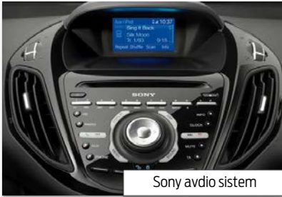
Sony avdio sistem