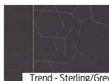
Trend - Sterling/Grey