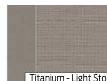
Titanium - Light Stone