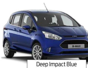
Deep Impact Blue