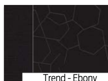
Trend - Ebony