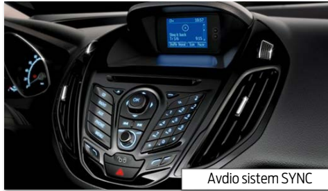
Avdio sistem SYNC