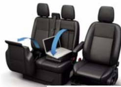
Dvojni sovoznikov sedež z dvizno blazino