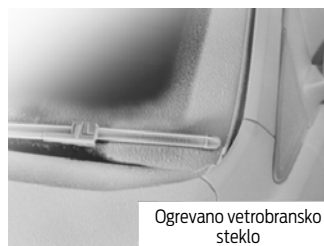
Ogrevano vetrobransko steklo