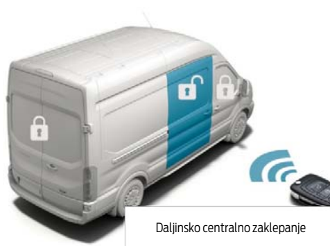
Daljinsko centralno zaklepanje