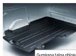
Gumirana talna obloga