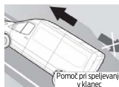
Pomoč pri speljevanju v klanec

Zaščitne bočne obloge tovernega dela v polovični višini