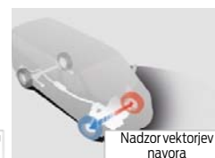
Nadzor vektorjev navora