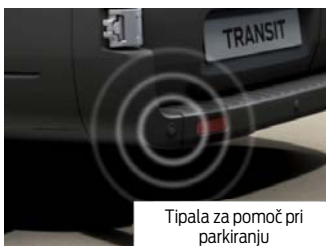
Tipala za pomoč pri parkiranju