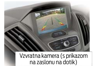
Vzratna kamera (s prikazom na zaslonu na dotik)