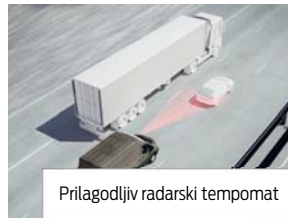
Prilagodljiv radarski tempomat