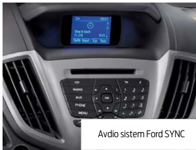
Avdio sistem Ford SYNC