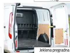
Jeklena pregradna stena z oknom