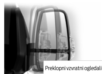
Preklopni vzvratni ogledali