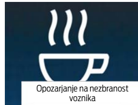
Opozarjanje na nezbranost voznika