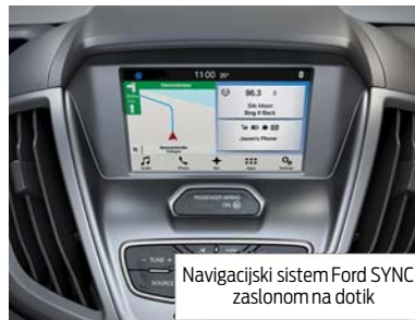
Navigacijski sistem Ford SYNC z zaslonom na dotik