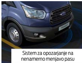
Sistem za opozarjanje na nenamerno menjavo pasu