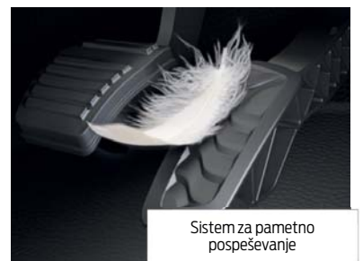
Sistem za pametno pospeševanje