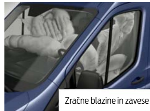
Zračne blazine in zavesi