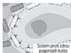
Sistem proti zdrsu pogonskih koles