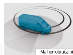
Majhen obračalni krog