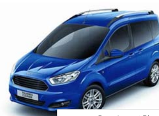
Deep Impact Blue