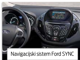
Navigacijski sistem Ford SYNC