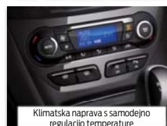
Klimatska naprava s samodejno regulacijo temperature