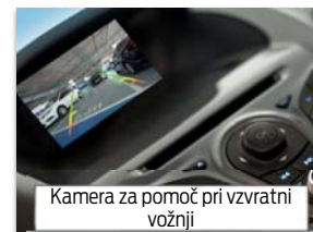
Kamera za pomoč pri vzvratni vožnji