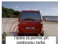
Tipala za pomoč pri parkiranju zadaj