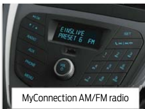
MyConnection AM/FM radio