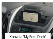
Konzola 'My Ford Dock'

Športni paket zunanosti in notranjosti Električno nastavljeni in ogrevani vzratni ogledali v črni barvi Vzdolžni strešni nosilci v črni barvi 16" 7x2 kraka platišča iz lahke zlitine v črni barvi s pnevmatikami 195/55 R16