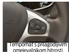
Tempomat s prilagodljivim omejevalnikom hitrosti