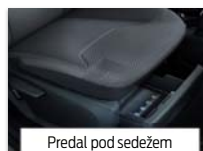
Predal pod sedežem