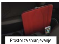
Prostor za shranjevanje