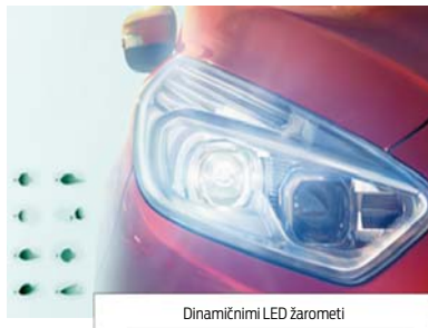
Dinamični LED žarometi