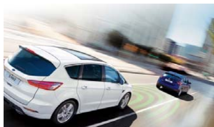
Active City Stop