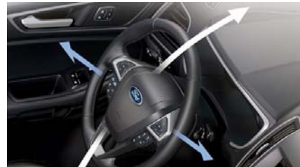
Nastavljiv volanski drog