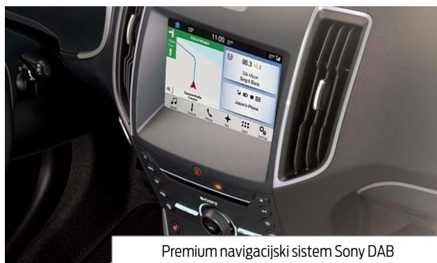
Premium navigacijski sistem Sony DAB