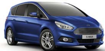
Deep Impact Blue