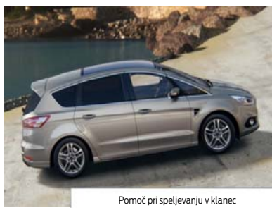
Pomoč pri speljevanju v klanec