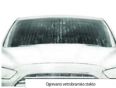
Ogrevano vetrobransko steklo

Ko imate polne roke, pri sebi pa imate obesek za prostoročni ključ, bo vaš novi Ford zaznal vašo bližino, tako da morate z nogo samo zamahnuti pod zadnjim odbijačem in vrata prtljažnika se bodo samodejno odprla ali zaprla. Prtljažna vrata lahko upravljate tudi z obeskom za prostoročni ključ ali prek gumbov v avtomobilu. Dvigavanje lahko prekinete kadar koli in prtljažna vrata se bodo ustavila.