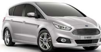
Moon dust Silver