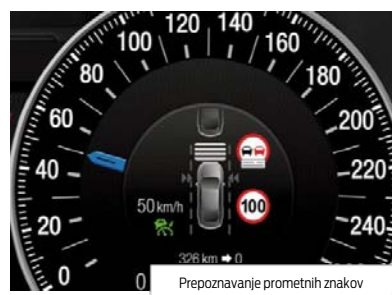
Prepoznavanje prometnih znakov