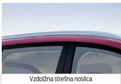
Vzdolžna strešna nosilca