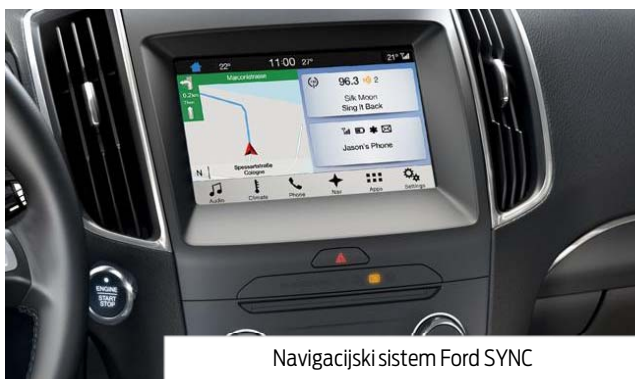
Navigacijski sistem Ford SYNC