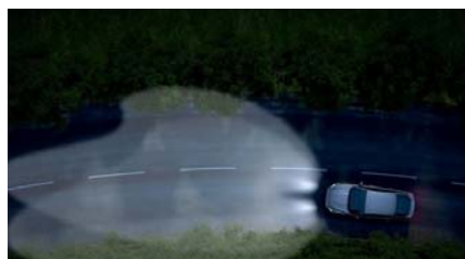
Aktivno prilagajanje svetlobnega snopa 'Ford Dynamic LED'