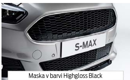
Maska v barvi Highgloss Black