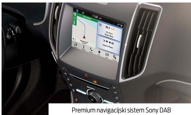
Premium navigacijski sistem Sony DAB