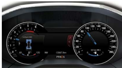
Digitalni sistem merilnikov