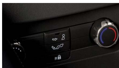
Tripodročna klimatska naprava