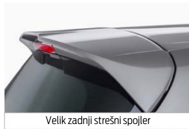
Velik zadnji strešni spojler