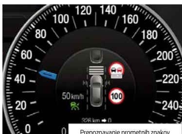
Prepoznavanje prometnih znakov