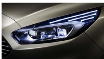
Dinamična žarometna s tehnologijo LED