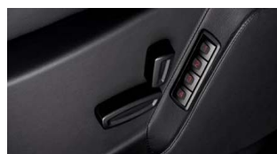
Električno nastavljlivi sedeži s spominsko funkcijo