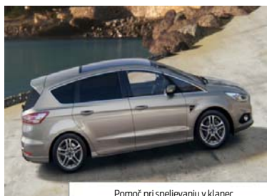
Pomoč pri speljevanju v klanec