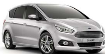
Moon dust Silver