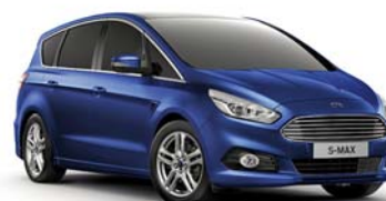
Deep Impact Blue