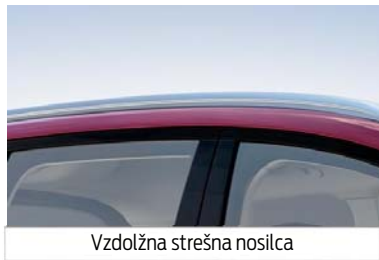
Vzdolžna strešna nosilca