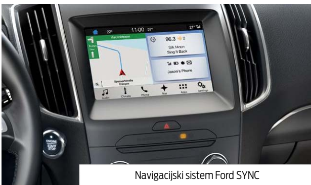
Navigacijski sistem Ford SYNC