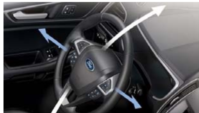
Nastavljiv volanski drog