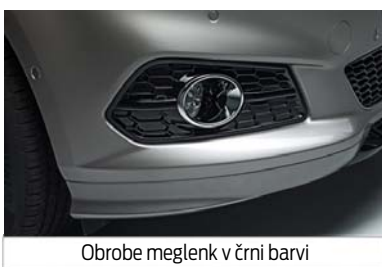
Obrobe meglenk v črni barvi