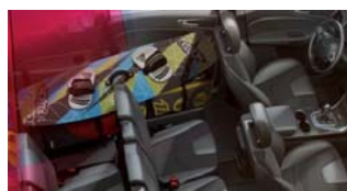
Sedeža v tretji vrsti