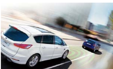
Active City Stop