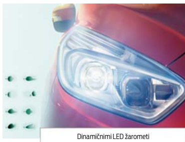
Dinamični LED žarometi