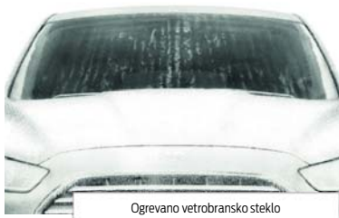
Ogrevano vetrobransko steklo

Ko imate polne roke, pri sebi pa imate obesek za prostorčni ključ, bo vaš novi Ford zaznal vašo bližino, tako da morate z nogo samo zamahniti pod zadnjim odbijačem in vrata prtljažnika se bodo samodejno odprla ali zaprla. Prtljažna vrata lahko upravljate tudi z obeskom za prostorčni ključ ali prek gumbov v avtomobilu. Dviganje lahko prekinete kadar koli in prtljažna vrata se bodo ustavila.