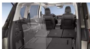
Elektro-mehanskega podiranje sedežev 'Easy Fold Flat'