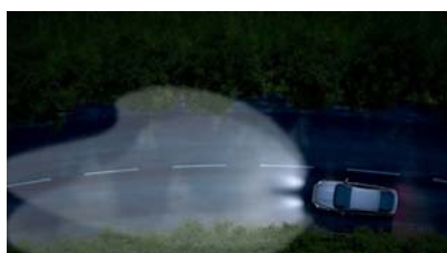
Aktivno prilagajanje svetlobnega snopa 'Ford Dynamic LED'