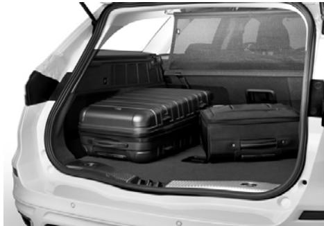
Mrežica za zaščito prtljažnega prostora