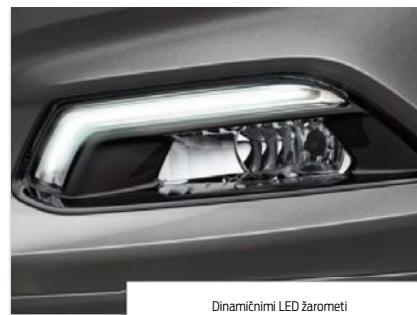
Dinamični LED žarometi