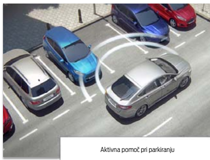
Aktivna pomoč pri parkiranju