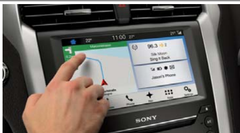
SYNC z ekranom na dotik