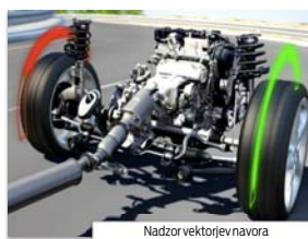
Nadzor vektorjev navora