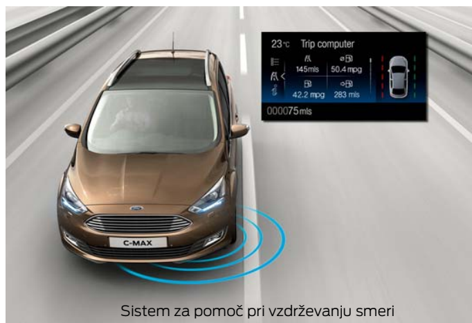
Sistem za pomoč pri vzdrževanju smeri