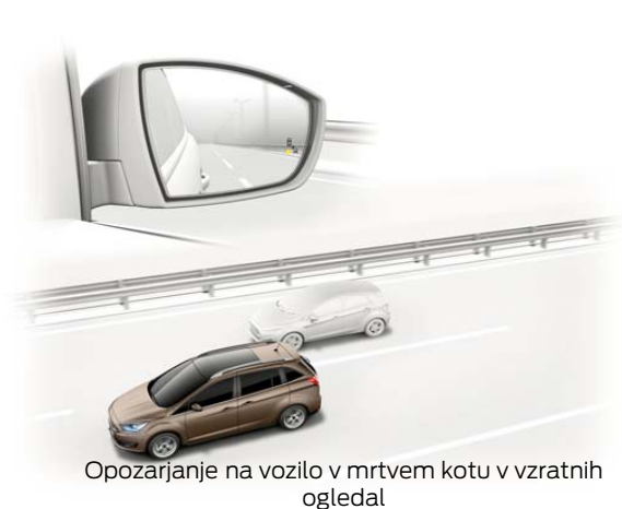
Opozarjanje na vozilo v mrtvem kotu v vzratnih ogledal