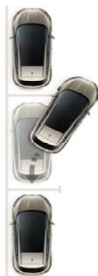
Aktivna pomoč pri parkiranju